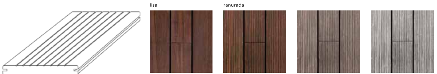
Evolución del color de MOSO® Bamboo X-treme® con el tiempo sin saturador: después de la instalación (dos imágenes a la izquierda), tras 3-6 meses (imagen del centro) y tras 18 meses (imagen a la derecha).

La tarima MOSO® Bamboo X-treme® está hecha de fibra de bambú termo tratada a 200°C y prensada a alta densidad. Este doble tratamiento la hace apta para la instalación al exterior, especialmente en suelos. MOSO® utiliza una patente que combina el termo tratamiento con la alta densidad proporcionándole una estabilidad, durabilidad y dureza inigualable. Su exclusiva testa machihembrada, única en materiales muy estables, hace posible la conexión ilimitada de lamas en longitud sin espacio en testas. Actualmente disponible para suelos, este producto también se puede utilizar en muchas aplicaciones al exterior tales como revestimientos verticales y celosías. Igual que las maderas tropicales, la tarima de MOSO® Bamboo X-treme® gradualmente se volverá más clara y gris, dando un aspecto muy natural.